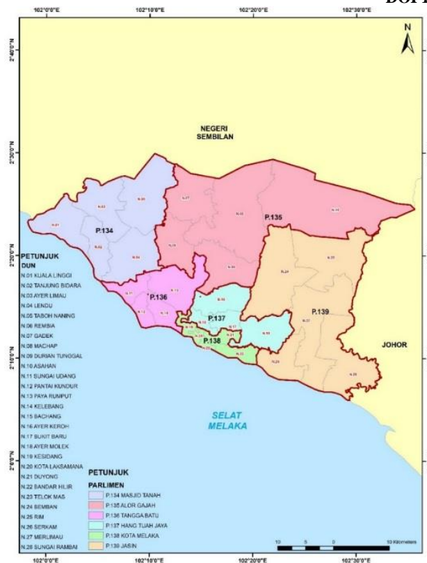
Rajah 1: Peta Bahagian-Bahagian Pilihan Raya Parlimen dan DUN di Negeri Melaka Bandaraya Bersejarah