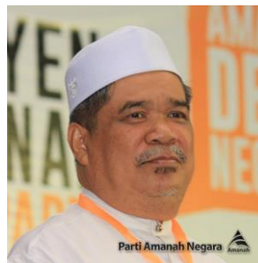
Rajah 7: Presiden Parti Amanah Negara sekarang (2015-sekarang/2019) iaitu Tuan Haji Mohamad Sabu