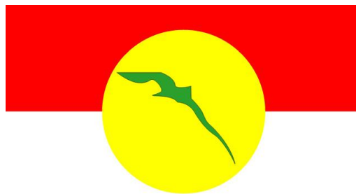
Rajah 2: Bendera Rasmi UMNO iaitu Sang Saka Bangsa