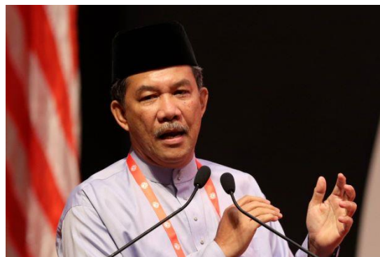
Rajah 5: Timbalan Presiden UMNO YB Dato' Seri Utama Mohamad bin Hasan

Selain itu, UMNO juga telah mengadakan Pemilihan UMNO pada 30 Jun 2018 dimana pertandingan jawatan Presiden UMNO telah dimenangi oleh Dato' Seri Ahmad Zahid Hamidi manakala jawatan Timbalan Presiden UMNO pula dimenangi oleh Dato' Seri Mohamad Hassan. Namun Dato' Seri Ahmad Zahid Hamidi telah bercuti daripada menjalankan tugas sebagai Presiden UMNO bermula 18 Disember 2018 yang kemudiannya dipangku oleh Timbalan beliau iaitu Dato' Seri Mohamad Hassan (Lihat Rajah 5) bagi memastikan kelancaran gerak kerja parti.