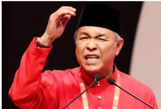
Rajah 4: Presiden UMNO (2018) YB Dato' Seri Dr. Ahmad Zahid bin Hamidi