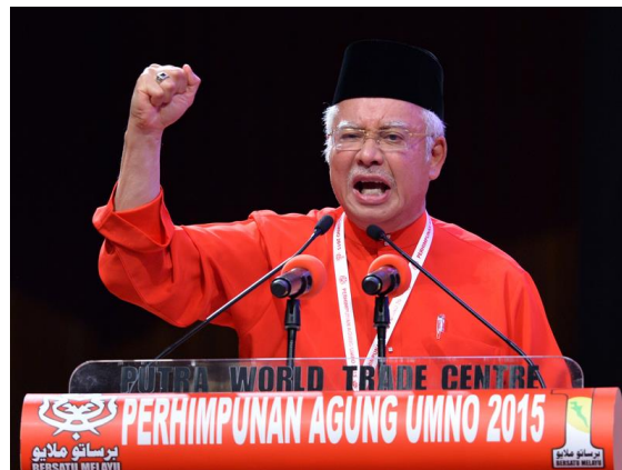
Rajah 3: Mantan Presiden UMNO (2009-2018) YB Dato' Sri Haji Mohd Najib bin Tun Haji Abdul Razak

Sumber: https://www.mynewshub.tv/utama-sensasi/167052/